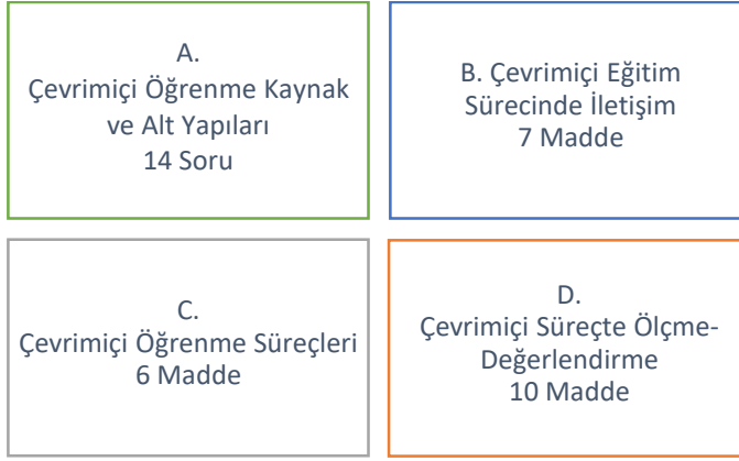
Şekil-1: Veri toplama araçlarının boyutları ve madde sayıları